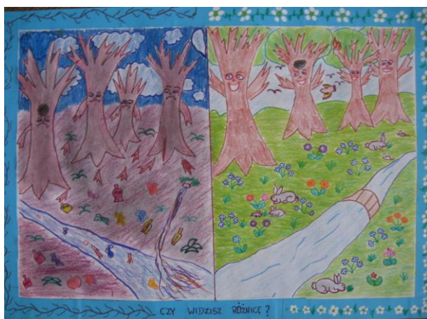
III miejsce Beata Pacyga