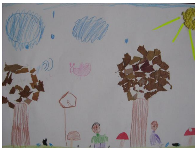
Wyróżnienie Dariusz Oleksa