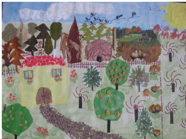
I miejsce Agnieszka Lach