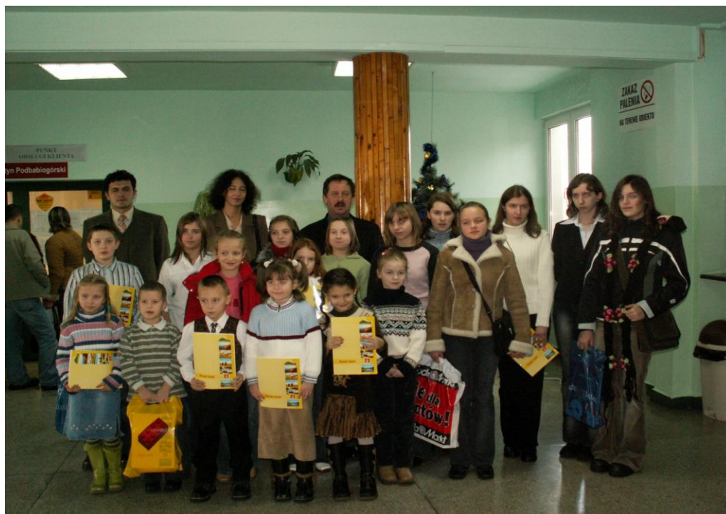
Laureaci konkursu wraz z organizatorami.

Wręczenie nagród dla Laureatów odbyło się podczas sesji Rady Powiatu Suskiego w dniu 29.12.2005 r.