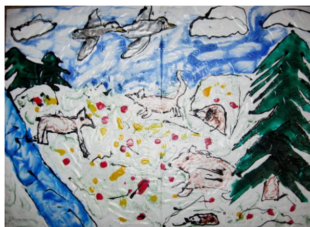
Wyróżnienie Kamila Klimala