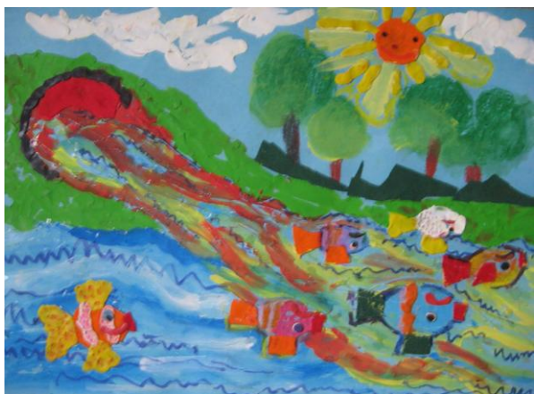
I miejsce Izabela Chadauli