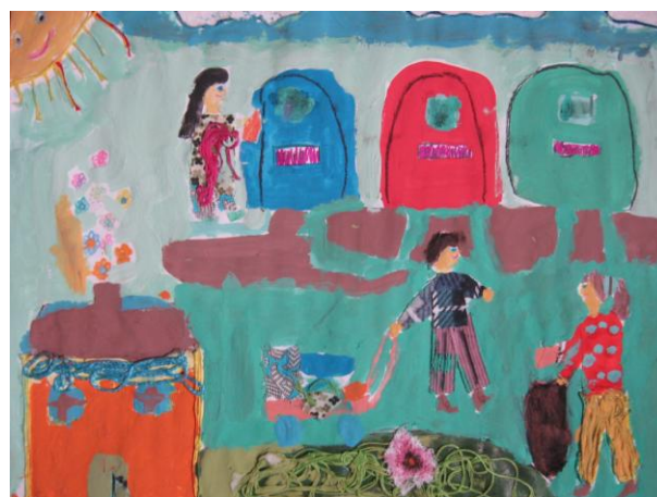
III miejsce Sylwia Stachoń