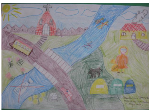
III miejsce Dominika Kubasiak