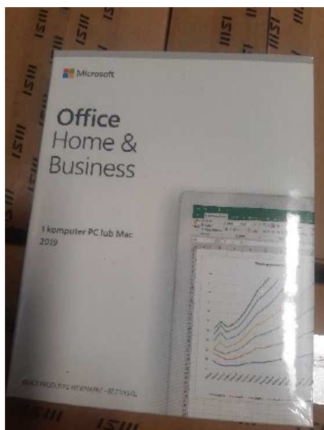
Rys. 3 Przykładowe zdjęcie pudełka dla produktu Microsoft Home&Business

Jesteśmy przekonani , że dzięki takiemu zapisowi do wzoru umowy Zamawiający otrzyma od potencjalnego Wykonawcy w pełni oryginalne oprogramowanie zgodne z warunkami licencjonowania producenta oprogramowania.