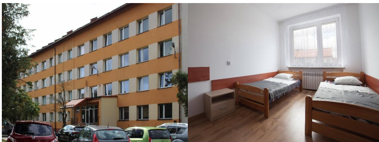
Szkolne Schronisko Młodzieżowe w Suchej Beskidzkiej